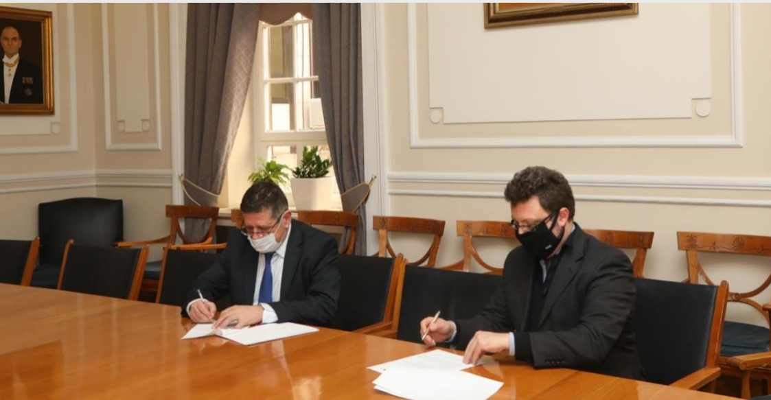
Από αριστερά: Πρύτανης Οικονομικού Πανεπιστημίου Αθηνών Καθηγητής Δημήτριος Μπουραντώνης, Πρόεδρος Επιτροπής Ανταγωνισμού Καθηγητής Ιωάννης Λιανός

Την 1 η Μαρτίου 2021, υπογράφηκε Μνημόνιο Συνεργασίας μεταξύ της Επιτροπής Ανταγωνισμού και του Οικονομικού Πανεπιστημίου Αθηνών, από τον Πρόεδρο της Επιτροπής Ανταγωνισμού Καθηγητή κ. Ιωάννη Λιανό και του Πρύτανη του Οικονομικού Πανεπιστημίου Αθηνών Καθηγητή Δημήτριο Μπουραντώνη, για την εδραίωση και ενίσχυση της συνεργασίας μεταξύ των δύο μερών.