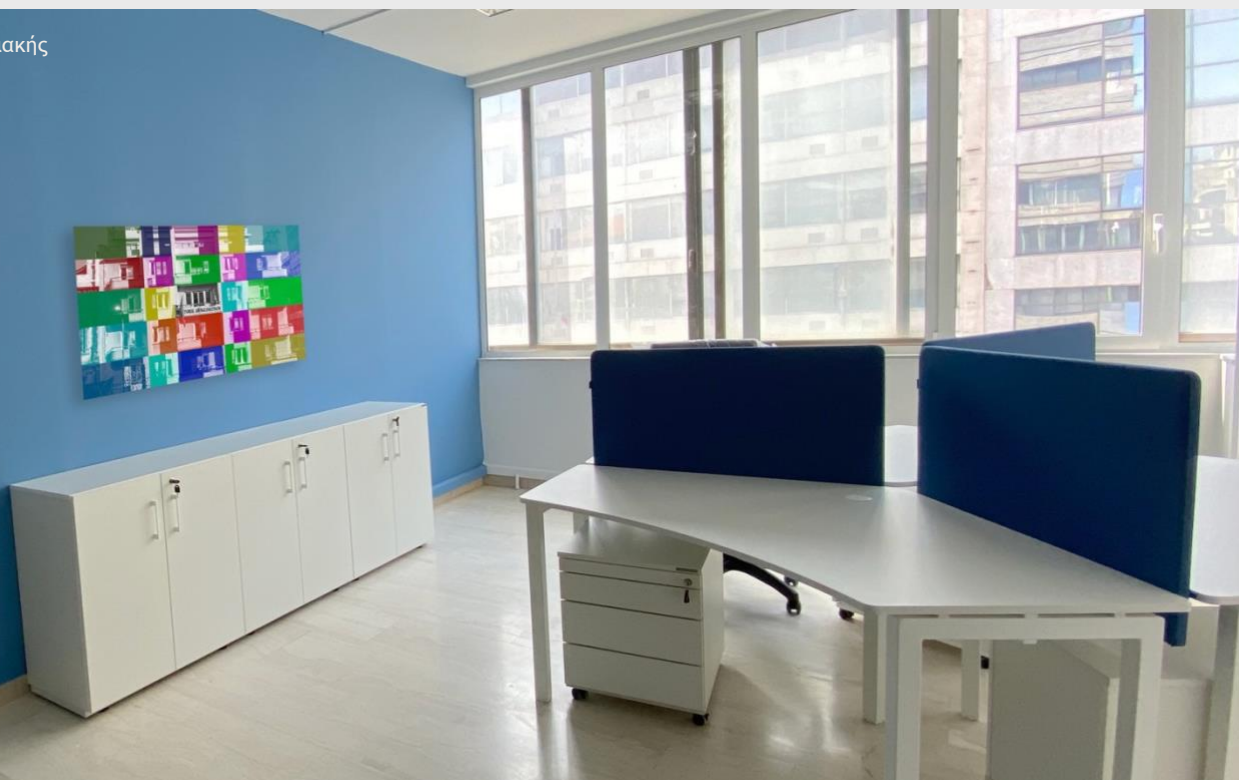
Τα νέα γραφεία του τμήματος Ψηφιακής Επικοινωνίας & Δημοσίων Σχέσεων