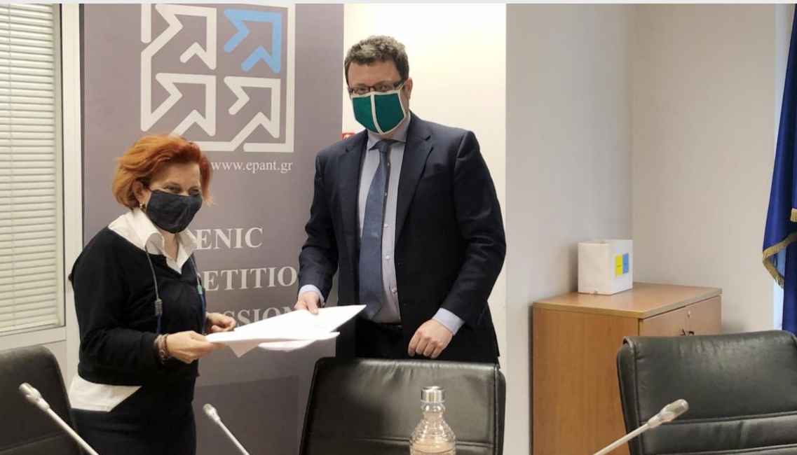
Από αριστερά: Πρυτάνισσα Πανεπιστημίου Αιγαίου, Καθηγήτρια Χρυσή Βιτσιλάκη, Πρόεδρος Επιτροπής Ανταγωνισμού Καθηγητής Ιωάννης Λιανός

Το Μνημόνιο Συνεργασίας που υπογράφηκε μεταξύ της Επιτροπής Ανταγωνισμού και του Πανεπιστημίου Αιγαίου, από τον Πρόεδρο της Επιτροπής Ανταγωνισμού Καθηγητή κ. Ιωάννη Λιανό και την Πρυτάνισσα του Πανεπιστημίου Αιγαίου Καθηγήτρια Χρυσή Βιτσιλάκη στοχεύει στην εδραίωση και ενίσχυση της συνεργασίας μεταξύ των δύο μερών.