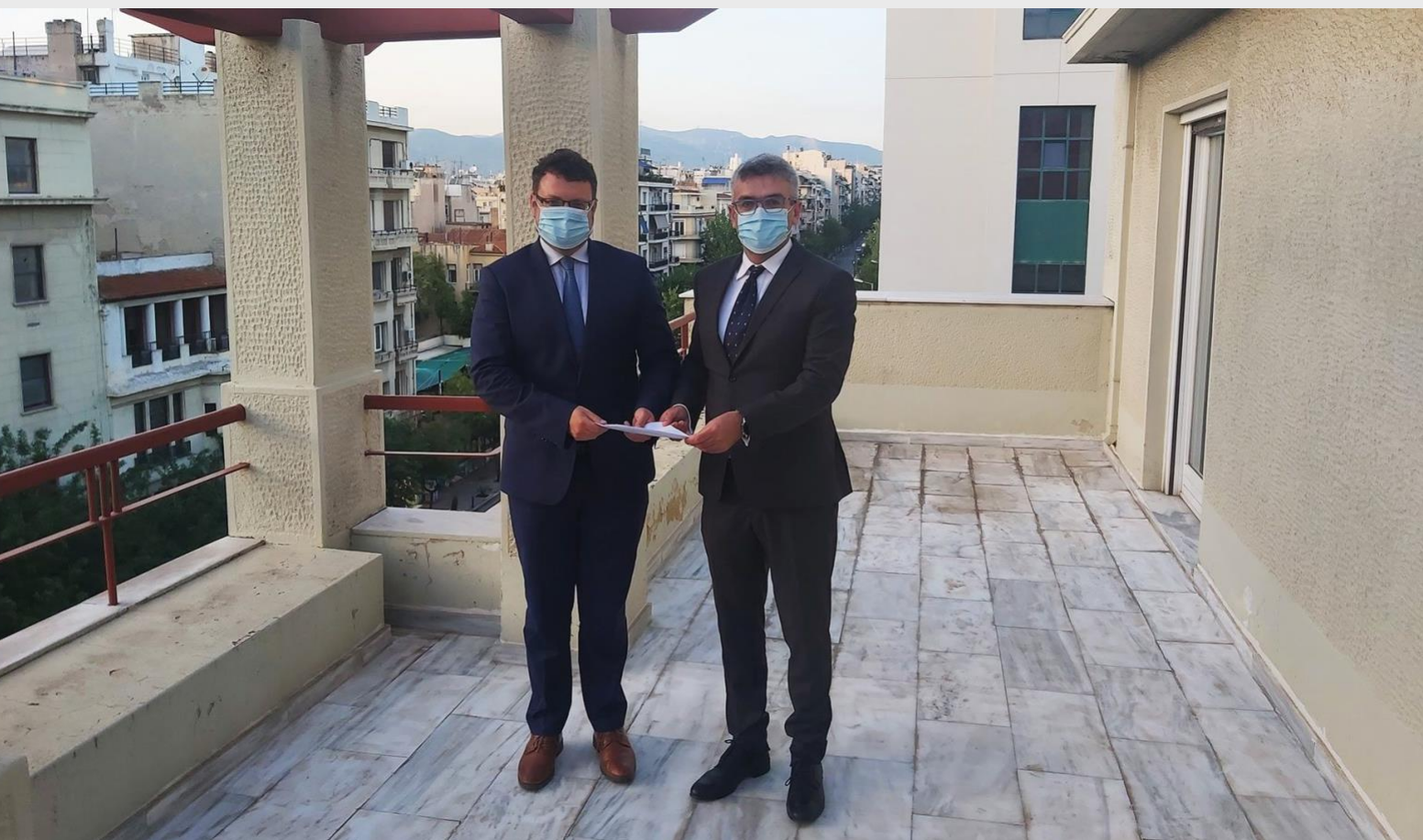
Από αριστερά: Ιωάννης Λιανός, Πρόεδρος Επιτροπής Ανταγωνισμού, Αθανάσιος Δαγουμάς, Πρόεδρος Ρυθμιστικής Αρχής Ενέργειας

Υπογράφηκε στις 25 Σεπτεμβρίου 2020, στα γραφεία της ΕΑ, Μνημόνιο Συνεργασίας μεταξύ της ΕΑ και της Ρυθμιστικής Αρχής Ενέργειας (ΡΑΕ), για την εδραίωση και ενίσχυση της συνεργασίας μεταξύ των δύο Αρχών, μέσω της αξιοποίησης των εμπειριών των δύο Αρχών και της ανάπτυξης στενότερων δεσμών μεταξύ τους.